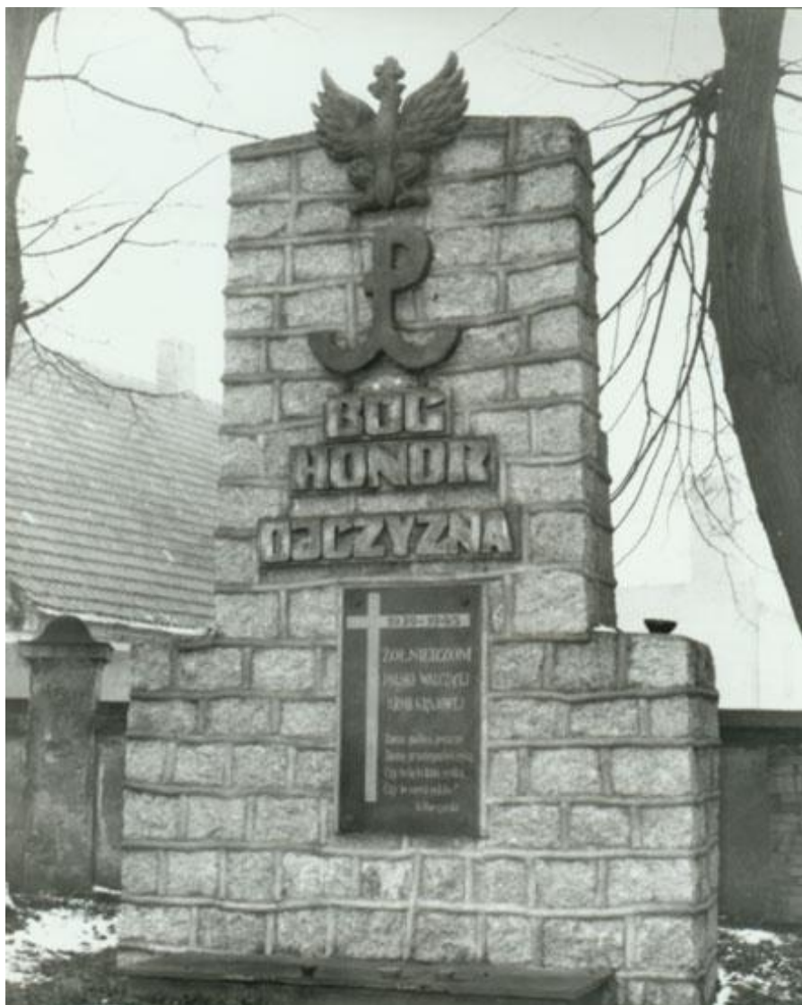
Tablica epitafijna i pomnik ufundowany przez żołnierzy Brygady w Rucianem – Nidzie.