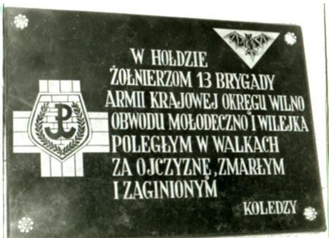
Tablica epitafijna Brygady w kościele w Warszawie.