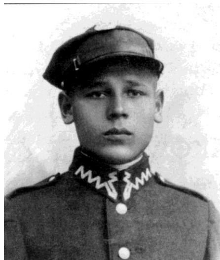
Pierwszy Dowódca „Grupy Dąb” przemianowanej następnie w 13. Brygadę