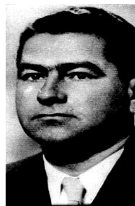
D-ca 2 plutonu/kompanii