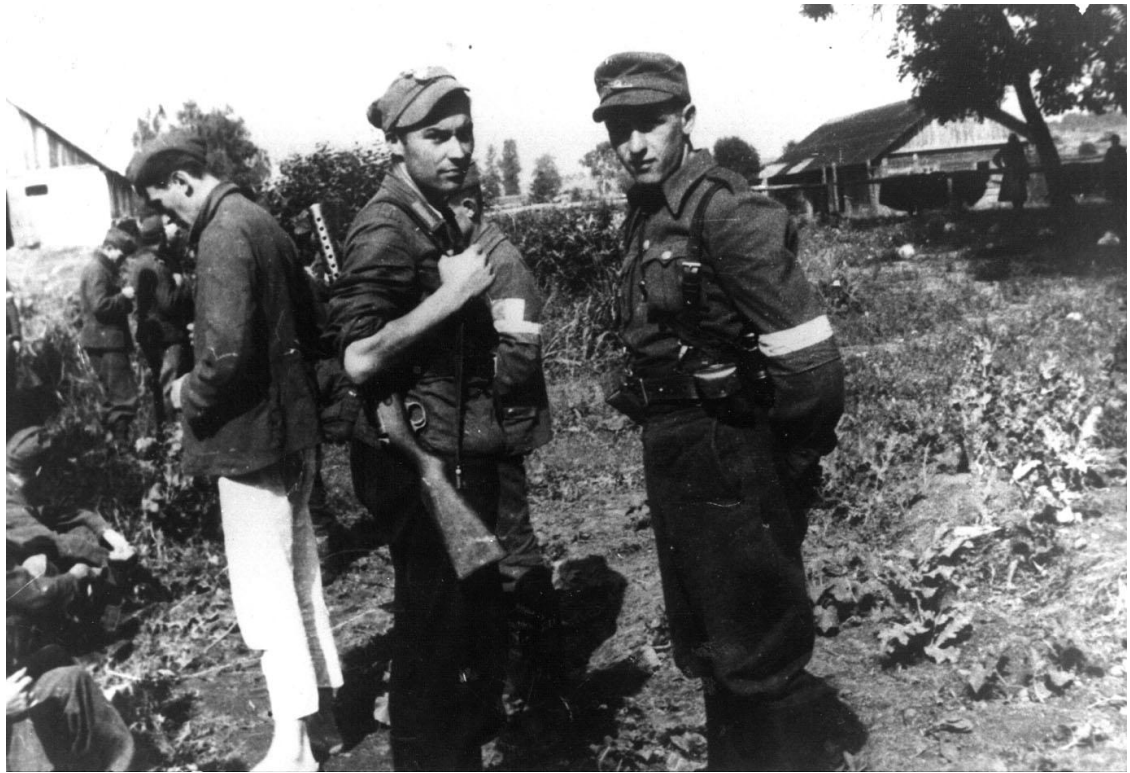
Konwojowanie niemieckich jeńców wojennych do Wilna. Kwiecień 1944 r.