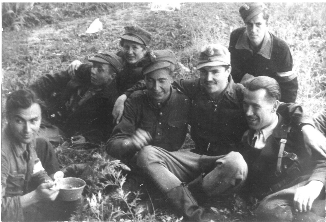
Wiosna 1944 r. Po patrolu