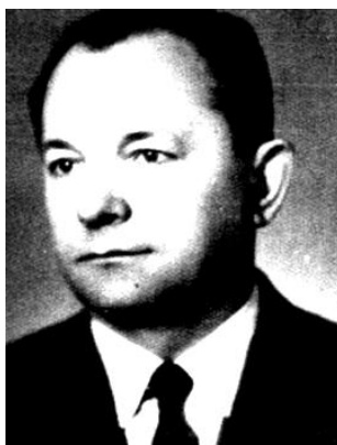
D-ca 1 plutonu/kompanii