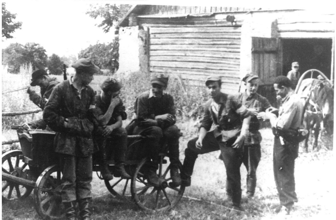
Kwiecień 1944 r. Po akcji na skład bomb lotniczych w Jaszunach.