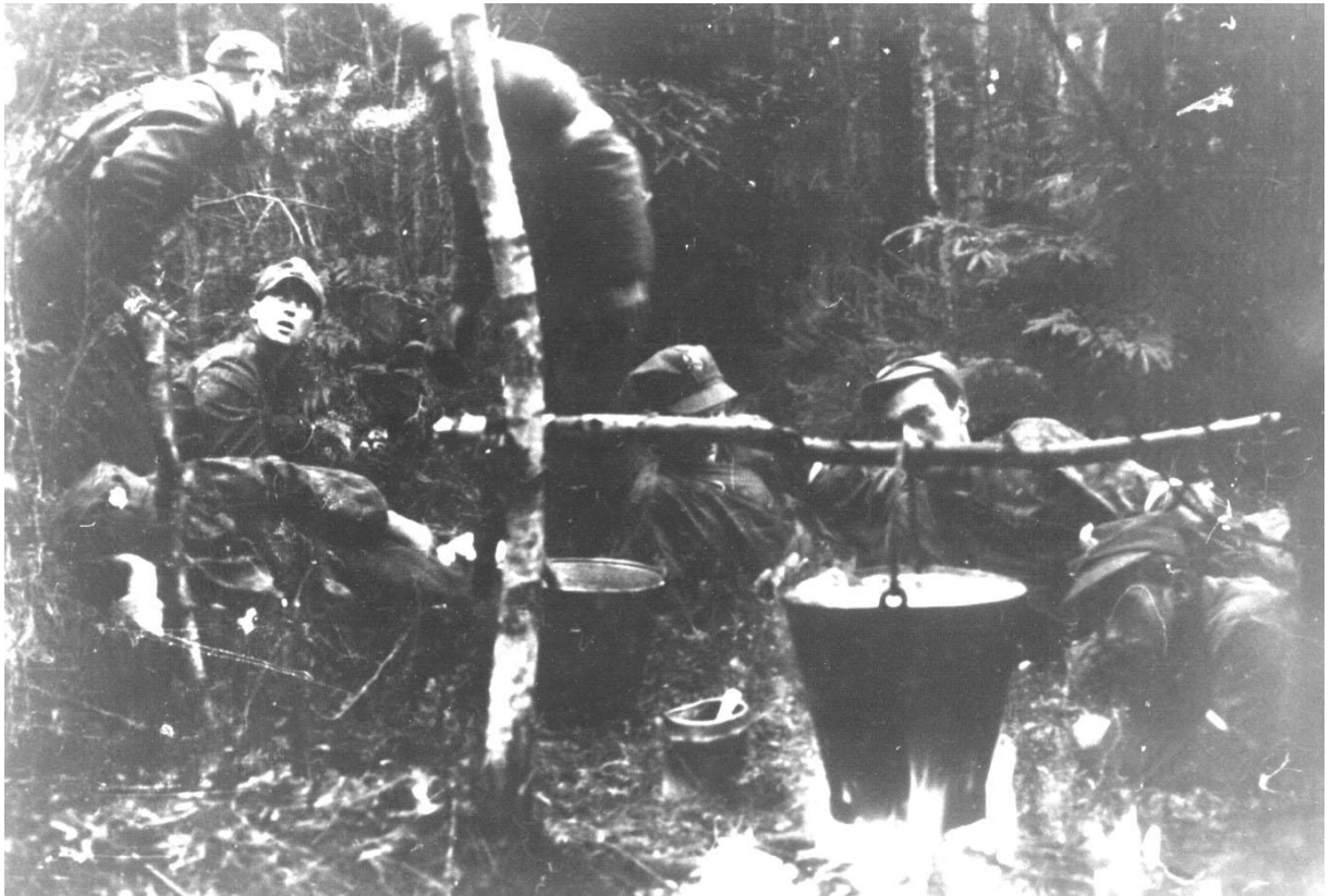
Maj 1944 r. Puszcza Rudnicka. Gotowanie posiłku.