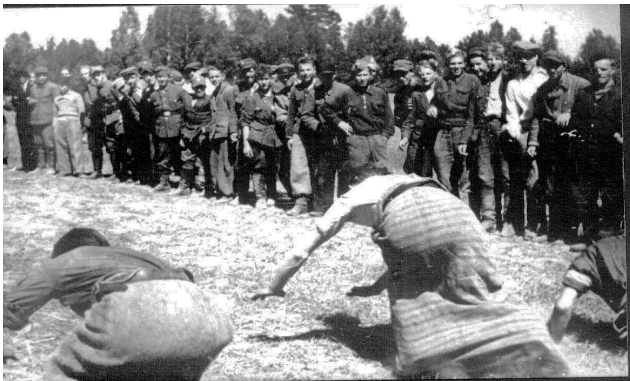
Ćwiczenia połączone z zabawą sanitariuszek. Podchodzenie do rannego na polu walki. Maj 1944 r.