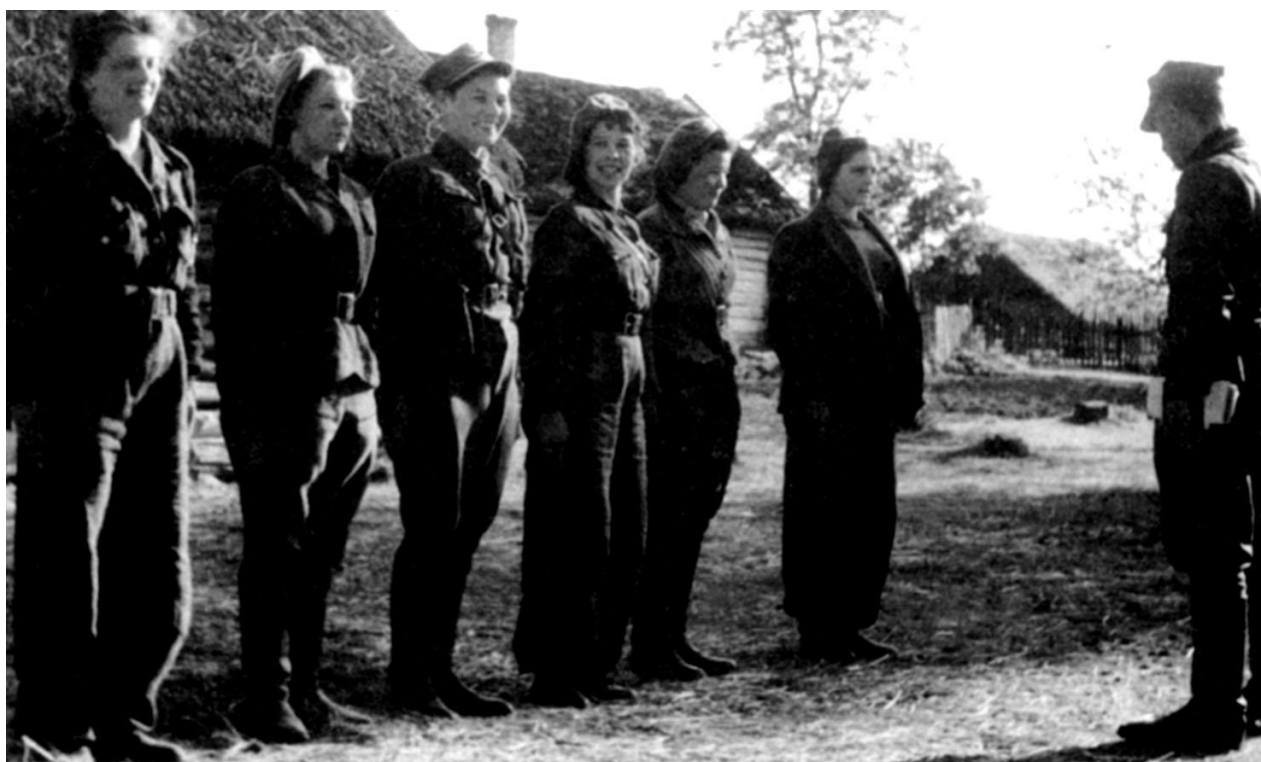
Odprawa sanitariuszek 4. i 5. Brygady przed wspólną akcją .