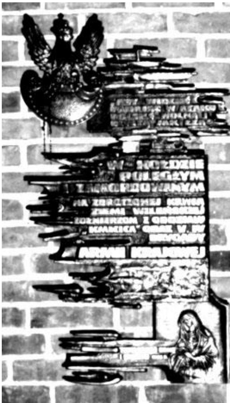
Tablica epitałijna w kościele pod wezwaniem Św. Barbary w Gdańsku.