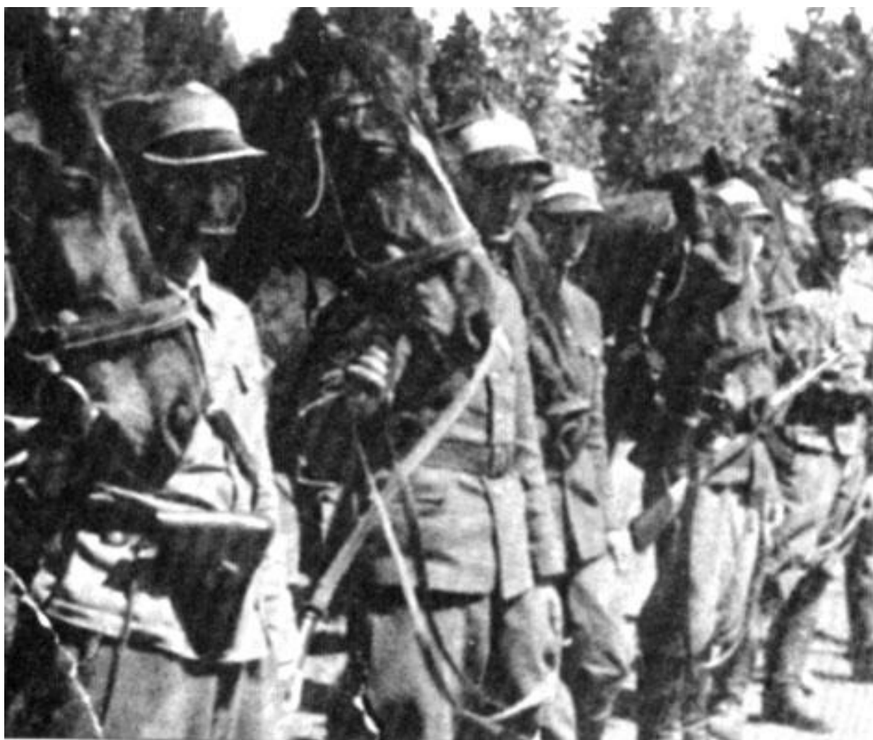
Odprawa zwiadu konnego. Lato 1944 r.