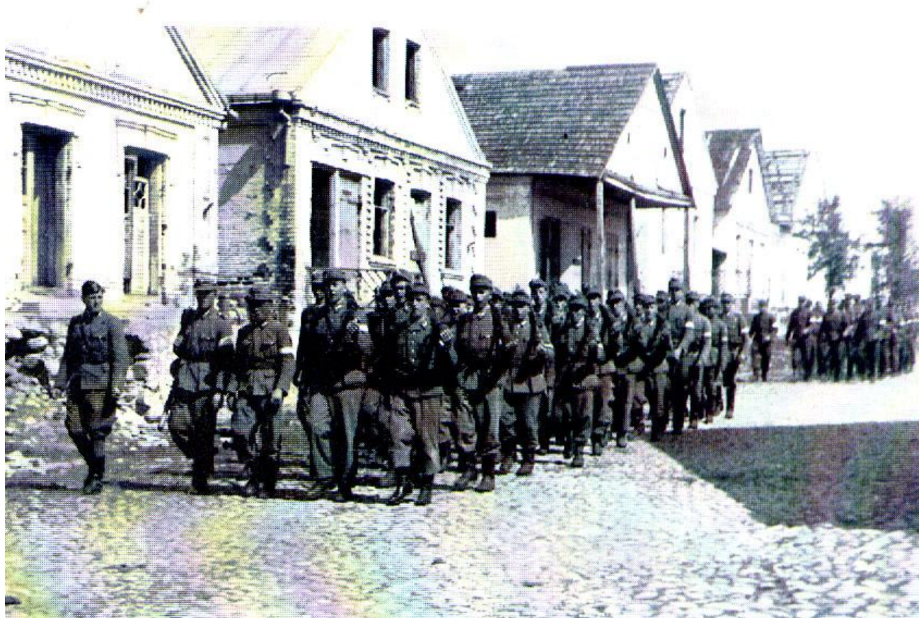
Dziewieniszki. Czerwiec 1944 r. Przemarsz 1 i 2 plutonu przez wieś.