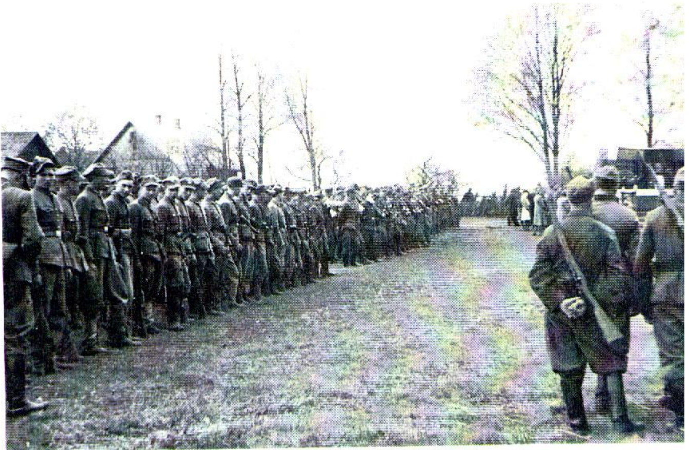
Dorże. Początek maja 1944 r. 1 i 2 plutonu na koncentracji III Zgrupowania.