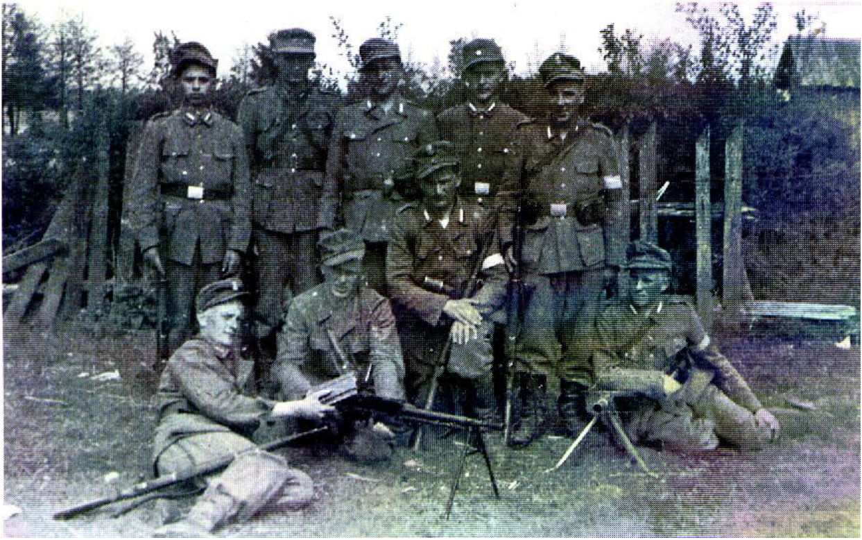
Grupa żołnierzy 3 plutonu na miejscu postoju. Początek czerwca 1944 r.