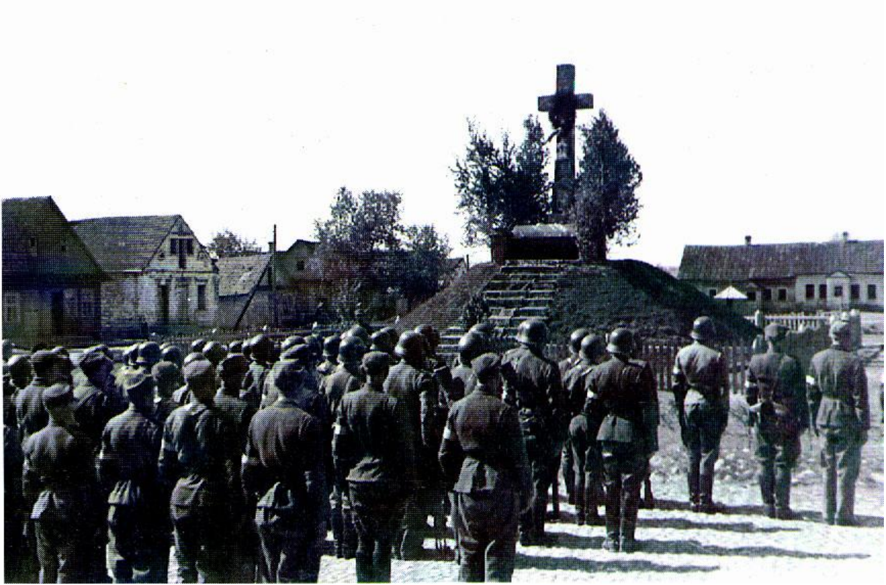
Dziewieniszki. Czerwiec 1944 Żołnierze 1 i 2 plutonu przed popmnikiem upamiętniającym połączenie Ziemi Wileńskiej z Macierzą.