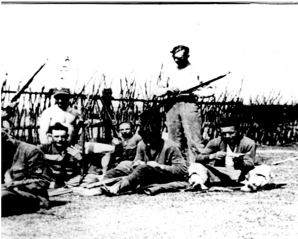
Maj 1944 Nowa Wieś k/Oszmiany. Czyszczenie broni.