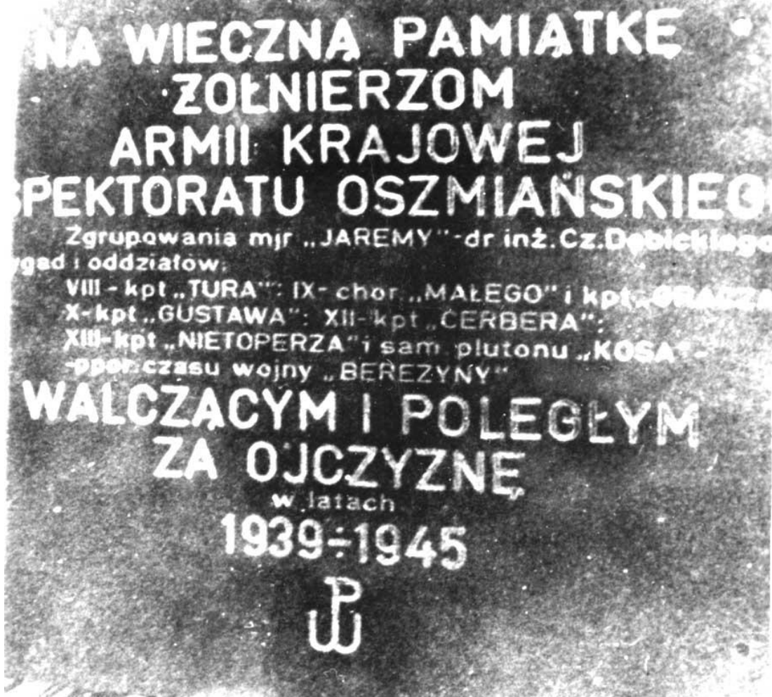
Brygadowa tablica epitafijna w kościele p. w. Matki Boskiej Zwycięskiej w Toruniu. Odslonięta i poświęcona 12.05.1984 r.