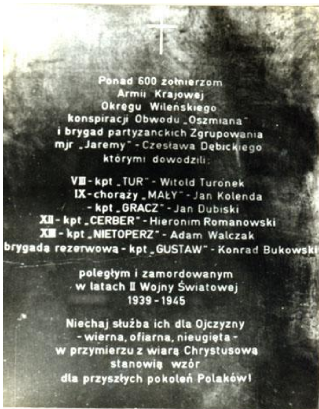
Brygadowa tablica epitafijna w kościele p. w. Matki Boskiej Ostrobramskiej w Rucianem-Nida. Odsłonięta i poświęcona 09.09.1984r.