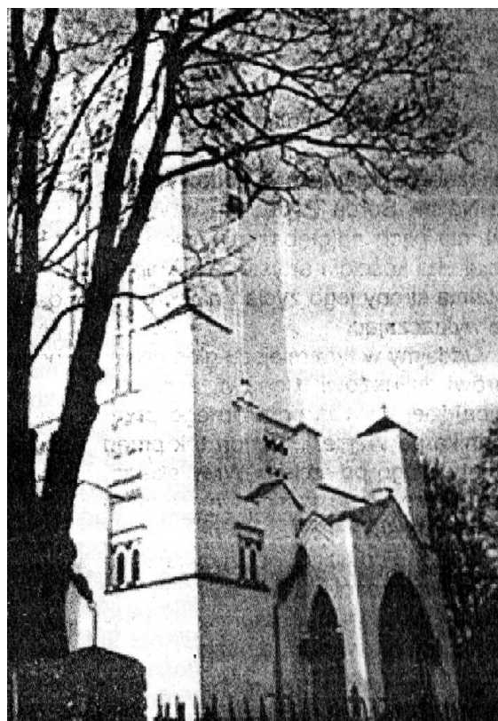
Kaplica w Szydłowie koło Rosień wg projektu A. Wiwulskiego.