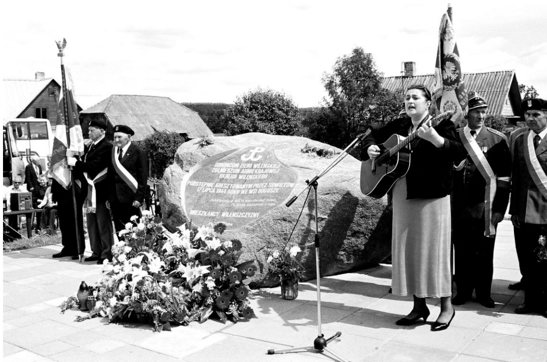
Bogusze. Uroczystość odsłonięcia pomnika.