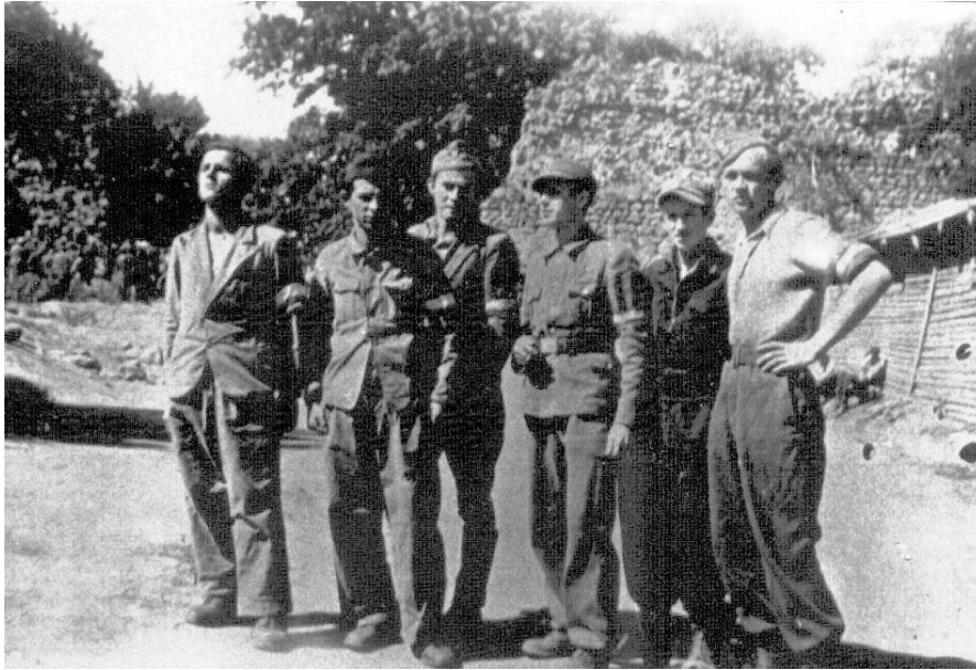
Miedniki Królewskie. Lipiec 18 - 28.07.1944. Grupa aresztowanych żołnierzy Armii Krajowej Okręgu Wileńskiego.

W nocy z 26 na 27 lipca 1944 roku zostały zwiększone patrole, pilnujące wokół murów jak i przy bramie. Nie wypuszczano już nikogo na zewnątrz, a grupa przywożąca wodę otrzymała silny konwój.