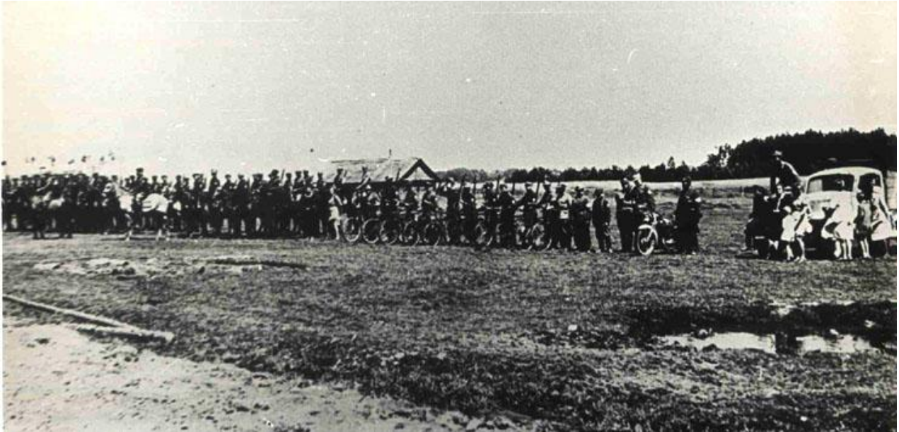
Oddział Rozpoznawczy Komendanta Okręgu w dniu 27. 06. 1944 r.