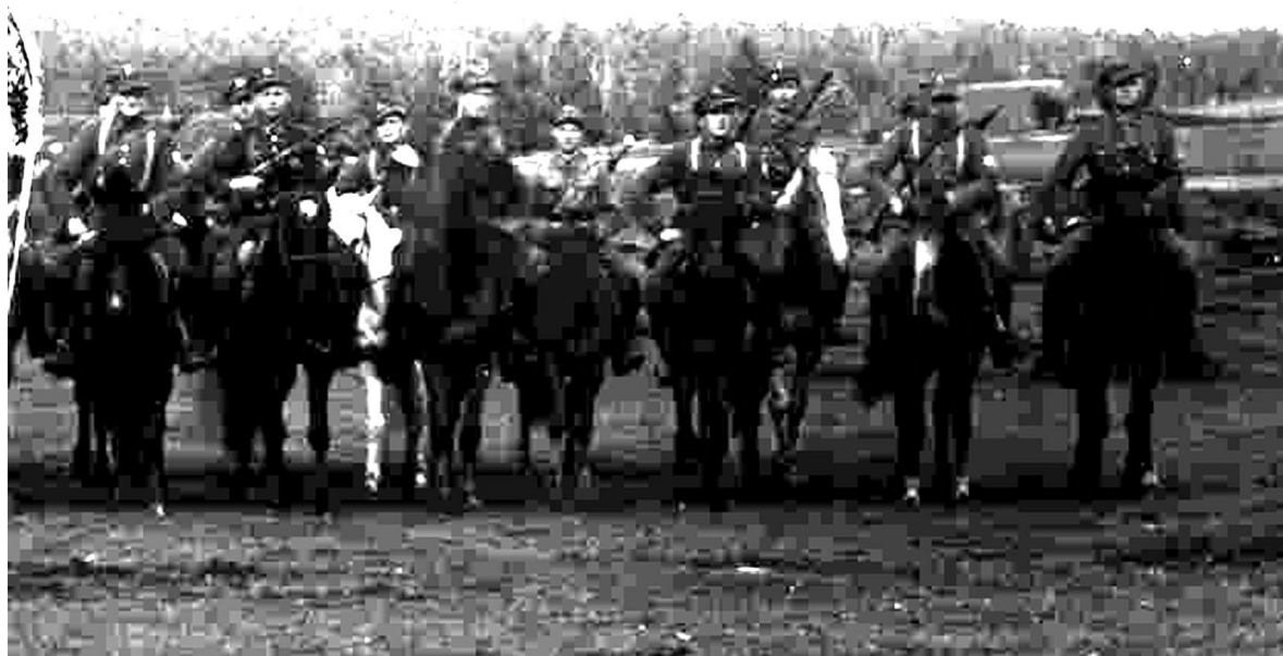
Żołnierze 1-go plutonu Od lewej : szósty Janusz Hrybacz „Zawisza”