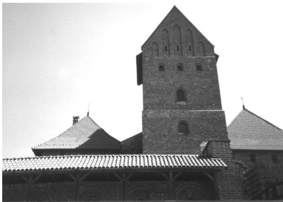
Nowe Troki. Zamek najeziorny. Widok obecny 2006 r