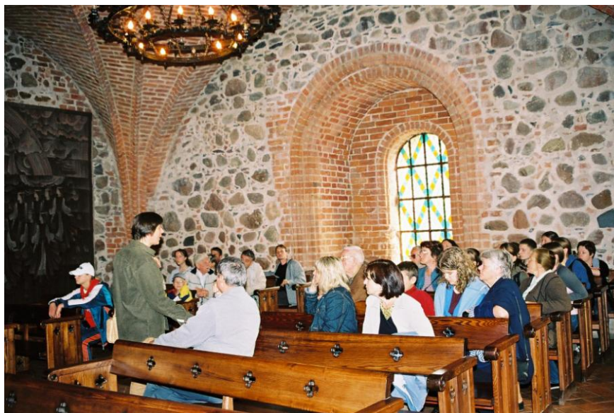
Komnaty zamku najeziornego w Trokach. Stan obecny 2005 r

Jako osiedle ściśle związane tutaj z zamkiem powstało miasto Troki. Moment obronności górował tutaj nad każdym innym względem, nawet nad momentem komunikacyjnym. Zamek najeziorny, kontrolujący rozległy teren na łądzie, musiał mieć z nim wygodne i pewne połączenie. Temu celowi służył drewniany most, którego ślady na dnie jeziora są wciąż jeszcze widoczne. Most łączył się z lądem w dzielnicy karaimskiej. Oddawał więc Witold w ręce Karaimów kontrolę i obronę dostępu do zamku.