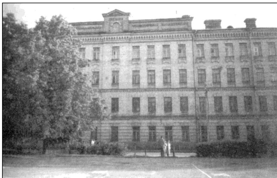
Łukiszki – więzienie, w którym przebywał „Szczepan”

"normalnym" badaniom. Dla organizmu wyczerpanego przebytą niedawno chorobą były to warunki szczególnie zabójcze. Z Ofiarnej został przeniesiony na Łukiszki, skąd 23 czerwca nastąpiła ewakuacja więźniów.